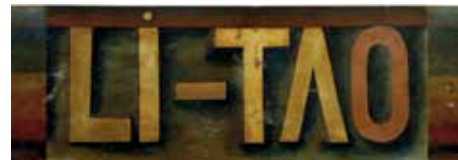
Cartel de la casa taller Xul Solar en Tigre, óleo sobre madera, 1954, 14,5 x 46 cm. Colección Fundación Pan Klub Museo Xul Solar, Buenos Aires.