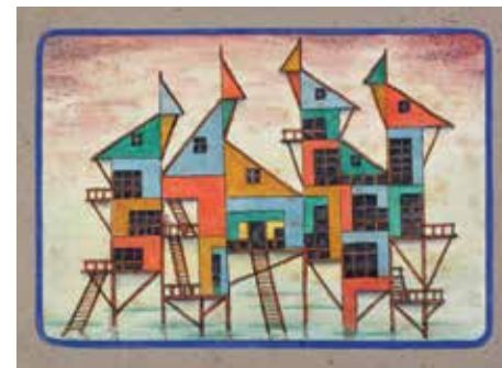
Proyecto fachada Delta (19) , 1954, acuarela y tinta sobre papel montado sobre cartón, 25 x 36 cm. Colección Fundación Pan Klub Museo Xul Solar, Buenos Aires.