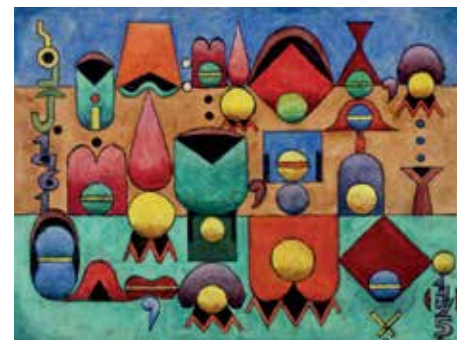
Muy wile , 1961, témpera y tinta sobre papel montado sobre cartón. Colección Fundación Pan Klub Museo Xul Solar, Buenos Aires.

En 1954, cuando compra su casa en Tigre, comienza un conjunto de proyectos arquitectónicos, fachadas y edificios para el Delta, donde retoma su interés por idear y representar un espacio comunitario. Por eso no es extraño que una de esas acuarelas fuera la fachada del Pan Klú Delta, un espacio para la confraternidad entre artistas e intelectuales, a orillas del río Luján en donde continuarían los encuentros del Pan Klub iniciados en 1939 en su casa de Buenos Aires, hoy Museo Xul Solar.