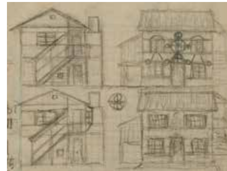
Xul Solar, cuaderno de apuntes CA-42, cuaderno marca “1910”; datado ca. 1950; distintas etapas de ejecución [1949-1954]; papel cuadriculado; 118 páginas; 22 x 17 cm; en su interior, dibujo en lápiz negro. Colección Fundación Pan Klub Museo Xul Solar, Buenos Aires.