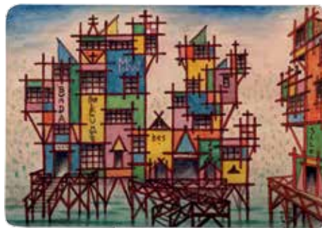
Proyecto Pan Klú Delta (4) , 1954, acuarela y tinta sobre papel, 26 x 36 cm. Colección Particular.

La casa LI - TAO en Tigre es una concreción de ese camino, que proyectara en su pintura.